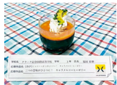
▲金賞 おやつレシピ部門 「三つの苦味がひとつに! キャラメルコーヒゼリー」