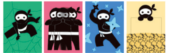
学生がデザインした各ブース達成シール