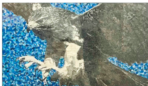
▲金賞 アート部門「翔」

平成19年度より始まった本プロジェクトですが、新しい高校生応援企画の検討のため、令和4年度にてコンテストを終了いたしました。おかげさまでこれまでに2,000件以上のご応募をいただきました。応募してくださった高校生の皆さま、高校関係者をはじめ多くの関係者の方に厚く御礼申し上げます。