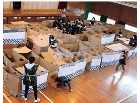
忍者屋敷は圧巻の迫力で子どもたちも大興奮