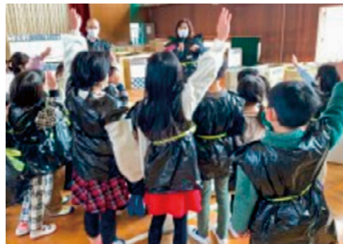
蜘蛛の巣くぐりブース 意欲満々