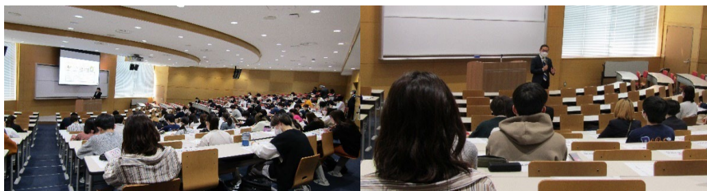
(教職オリエンテーションの様子)