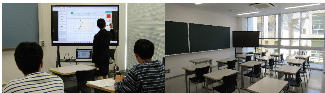
6号館 06114 教室【模擬授業実習室】

小学校教諭一種免許状取得に必要な実技教科（家庭科・美術科・保健体育科・音楽科）、および中学校教諭二種免許状（美術科・家庭科）の実習のための施設・設備は、専門学科を開設していることから充実している。